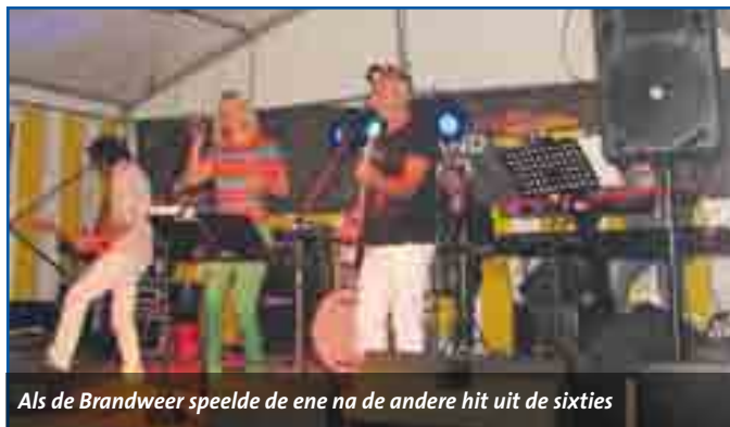
Als de Brandweer speelde de ene na de andere hit uit de sixties

Afgelopen zaterdag beleefde Zandvoort het vierde en tevens laatste muziekfestival van dit seizoen. Vanwege het historische raceweekend op het circuit was het thema van het evenement heel toepasselijk 'Back to the Sixties'. Op het circuit zorgden racewagens uit de sixties voor spektakel, op het Raadhuisplein waren de vooruitstrevende jaren zestig muzikaal voelbaar.